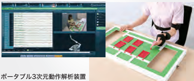
ポータブル3次元動作解析装置 マイオモーション

標準プッシュセンサーのほかに、プルセンサー、 ピンチセンサーなどオプションが充実。